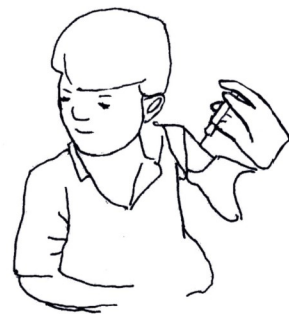
Getting the vaccine