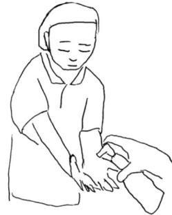
Using hand sanitizer