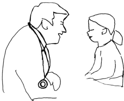
Talking to my doctor or nurse