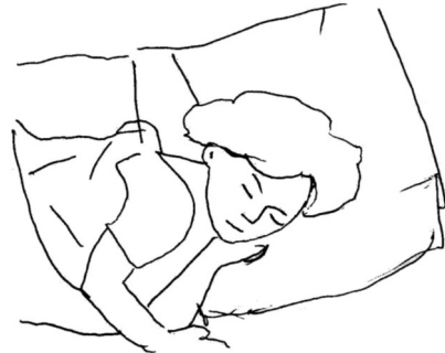
Staying home when I am sick