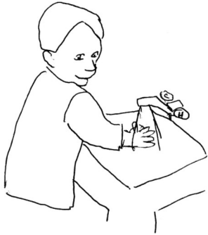
Washing my hands